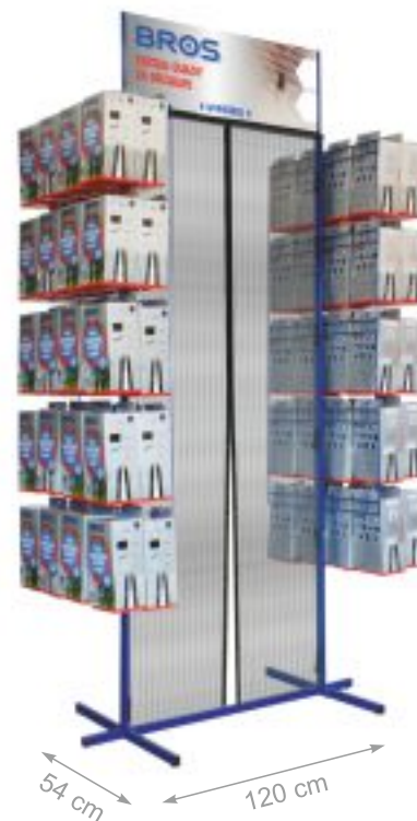
STOJAK NA SIATKI MAGNETYCZNE BROS