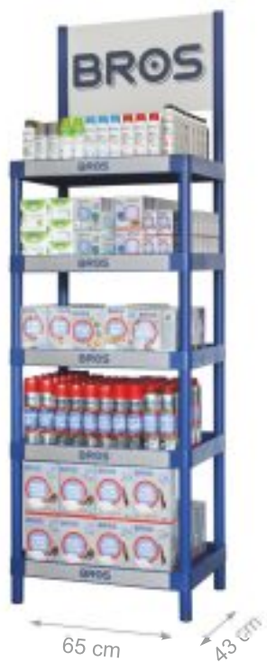
STOJAK EKSPOZYCYJNY BROS