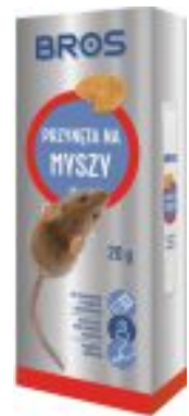
PRZYŃĘTA NA MYSZY