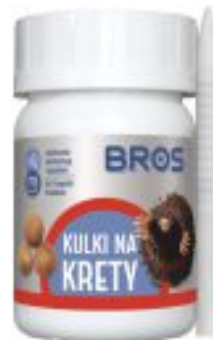
KULKI NA KRETY