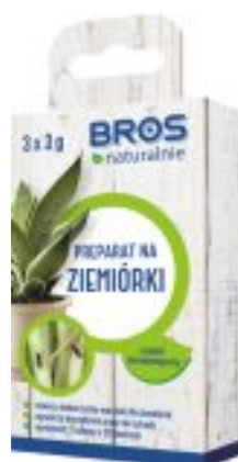
PREPARAT NA ZIEMIÓRKI