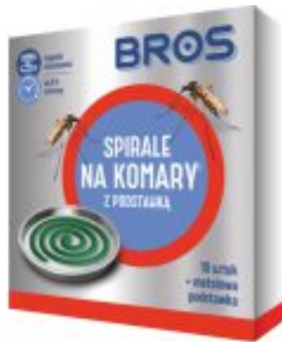
SPIRALE NA KOMARY Z METALOWĄ PODSTAWKĄ