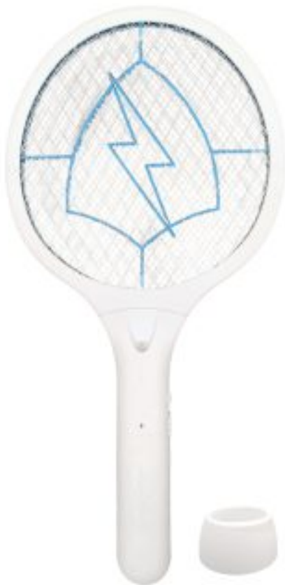
PACZKA ELEKTRYCZNA NA OWADY