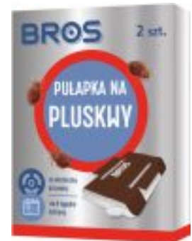
PULAPKA NA PLUSKWY