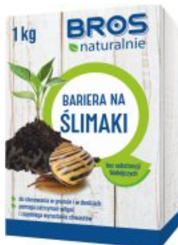
BARIERA NA ŚLIMAKI