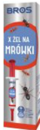
X ŻEL NA MRÓWKI