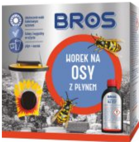
WOREK NA OSY Z PŁYNEM