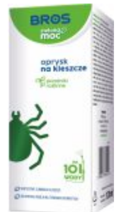
OPRYSK NA KLESZCZE